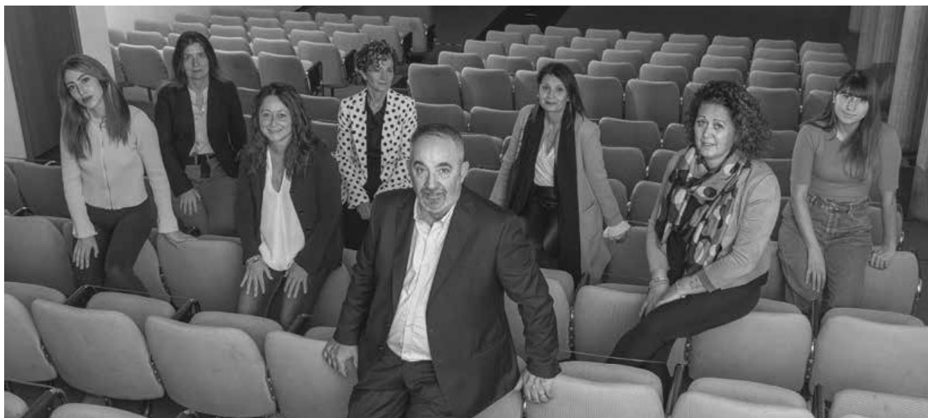
Lista "FIORENTINO VIVA"

Aiutaci a ridare valore e qualità alla "nostra" Fiorentino, a riportare inoltre quella socialità, quell'aggregazione che può ridisegnare una nuova Fiorentino Viva, SOSTIENICI, VOTA: FIORENTINO VIVA.