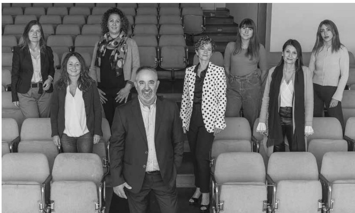
Lista "FIORENTINO VIVA"